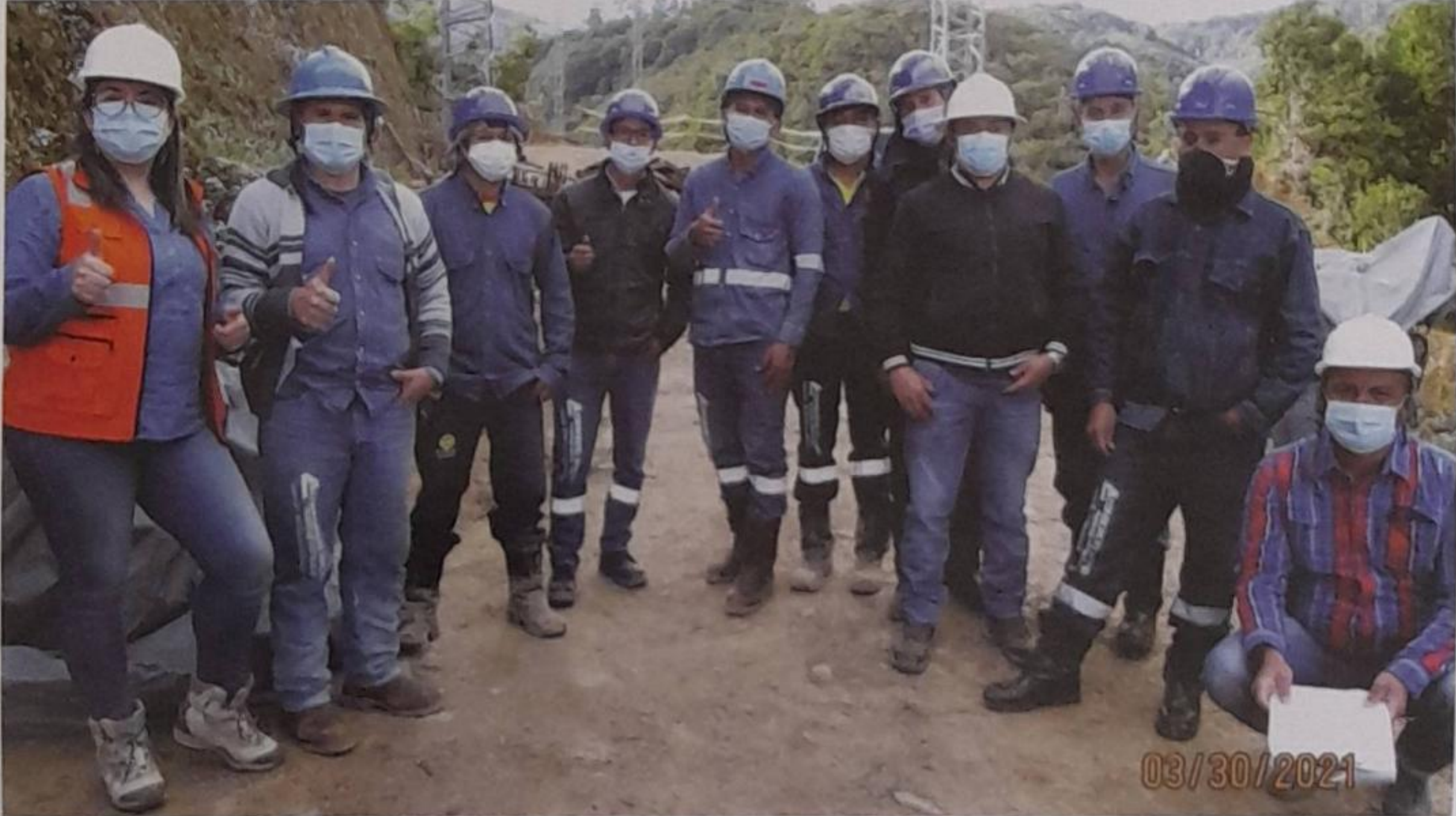
*Capacitación al personal encargado de la fabricación, transporte y montaje de la estructura metálica del puente